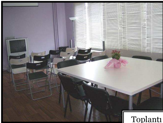
Toplantı ve Eğitim Odası

İkinci odada HIV/AIDS'le ilgili dokümanlar ve isteyen kişilerin kullanımına açık internet bağlantılı bir bilgisayar da bu salonda buluyor. Büyük salonunda ise planlanan eğitimler, toplantılar ve sanatsal aktiviteler yapılıyor.